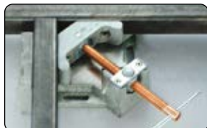
Uniones en T