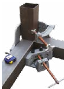
WAC45-SW 120 mm Capacidad!